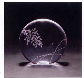
花切子のイメージ作品