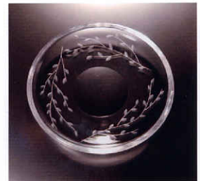
花切子のイメージ作品

「サンドブラスト」を組み合わせて、ガラスに自由な発想で、描く楽しさを味わって頂こうと企画した講座です。